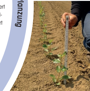
Austrieb der Stecklinge