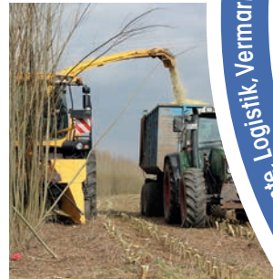
Ernte kurzer Umtrieb