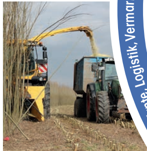
Ernte kurzer Umtrieb