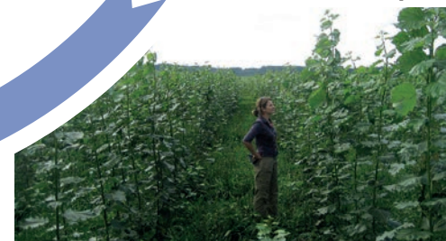
Einjährige Pappeln im Sommer

Die Anbaupraxis ist so individuell wie Ihre Fläche – mehr dazu bei www.wald21.com oder sprechen Sie uns an!