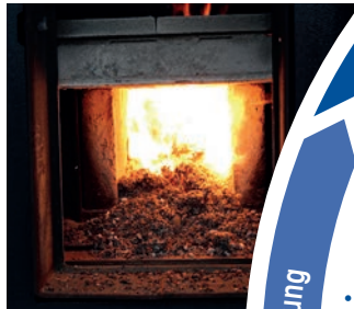
Wärme aus Hackschnitzeln