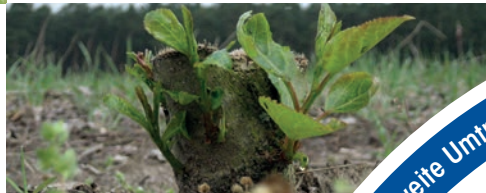
Wiederausschlag nach der Ernte