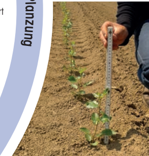
Austrieb der Stecklinge