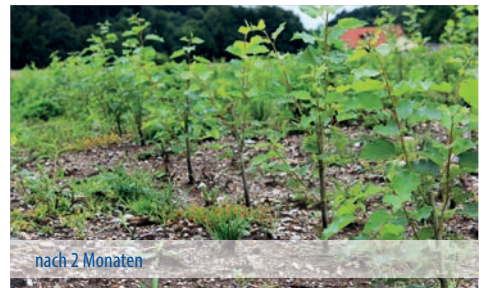
nach 2 Monaten